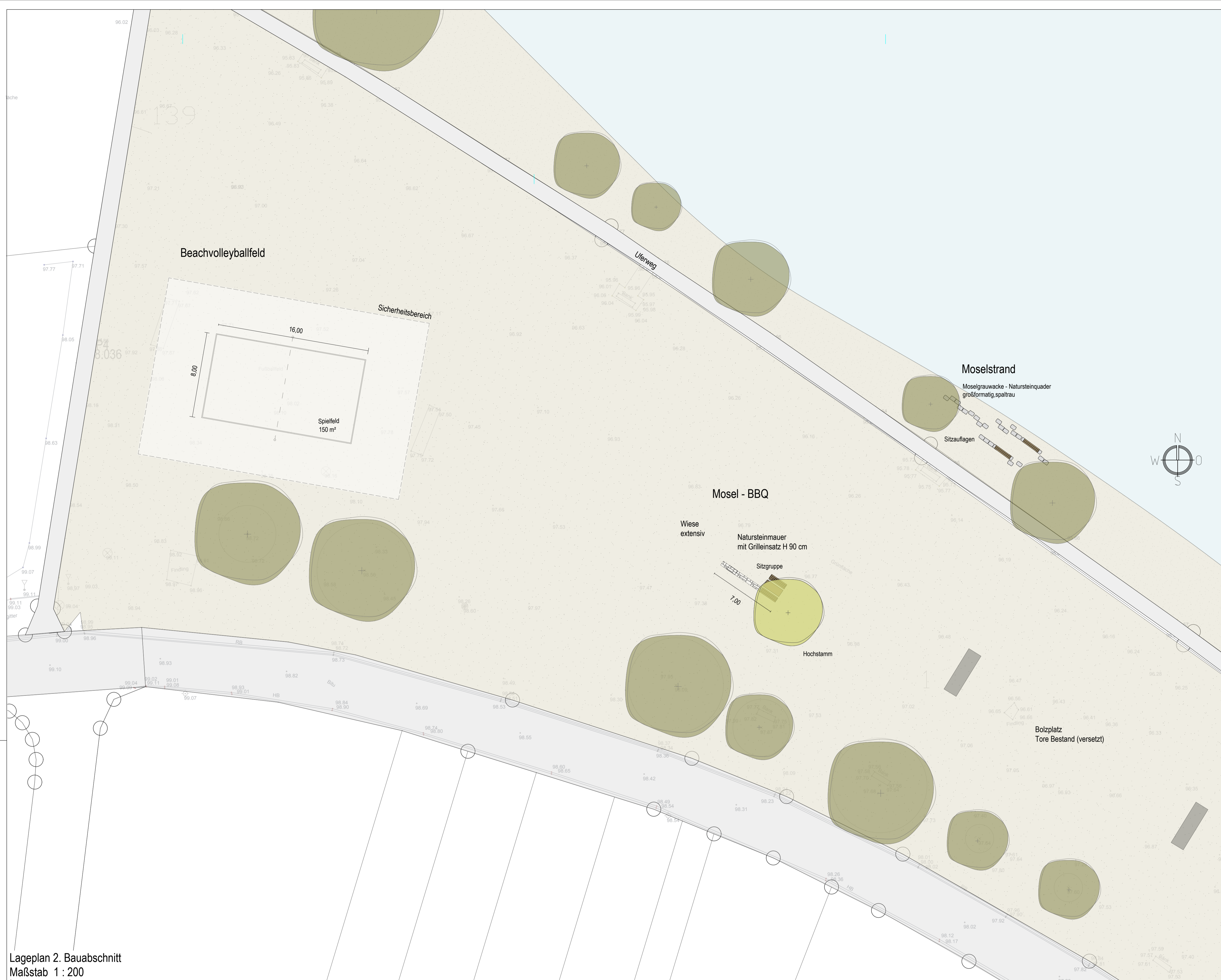
Lageplan 2. Bauabschnitt Maßstab 1 : 200