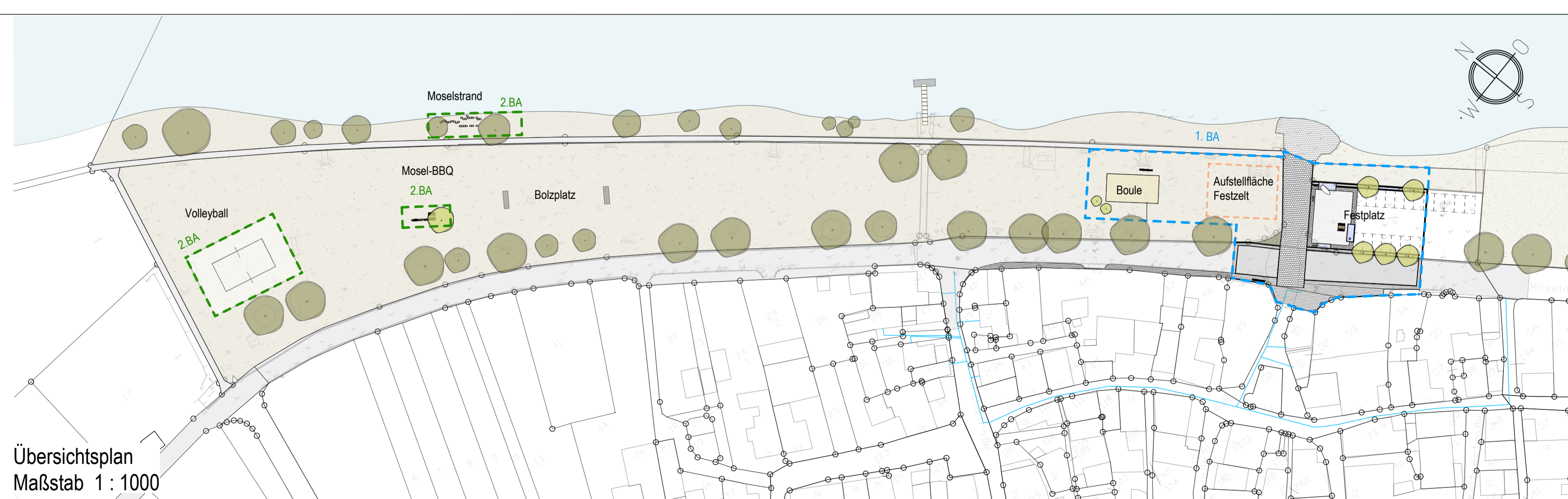
Übersichtsplan Maßstab 1 : 1000

Hinweis zu den Ver- und Entsorgungsleitungen Die nachrichtliche Übernahme der Leitungen erfolgte nach Angaben der jeweiligen Ver- und Entsorgungsträger. Die zeichnerische Darstellung gibt nur deren ungefähre Lage wieder.