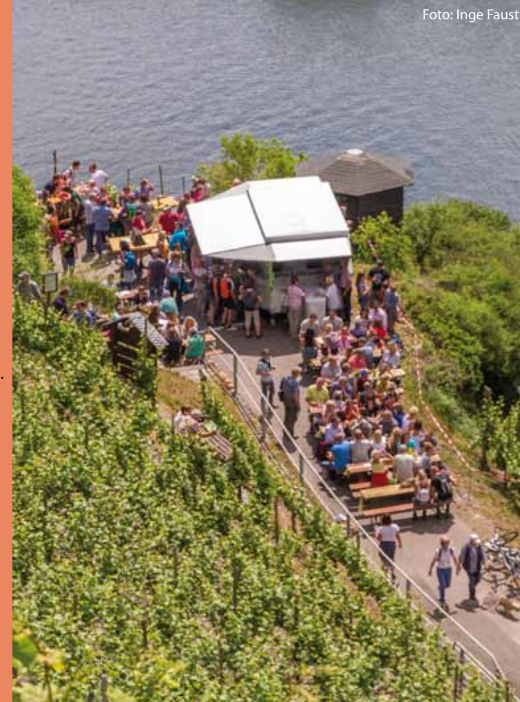
Angaben ohne Gewähr, Änderungen vorbehalten, Stand: April 2019