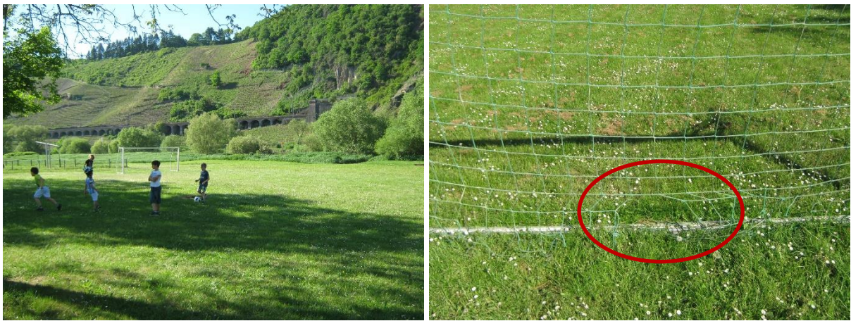
Der Bolzplatz ist bei den Kindern sehr beliebt