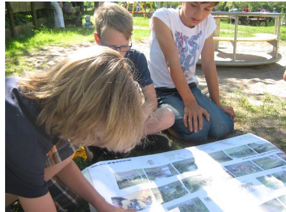
Im Anschluss an die Spielplatzbesichtigung wurden die Wünsche der Kinder zeichnerisch und textlich festgehalten. Der Moderator zeigte verschiedene Beispiele von Spielplätzen und Spielgeräten als kreativen Input.