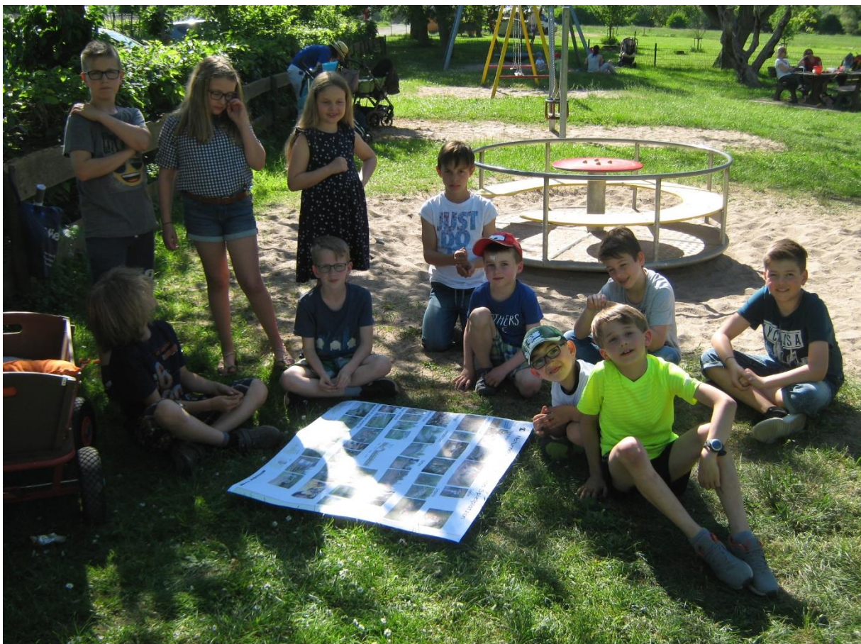
Erste Ideensammlung zum Thema Spielplatz

Die Kinder hatten die Verbesserung des Spielplatzes als eines ihrer wichtigsten Projekte benannt. Im Rahmen des 2. Treffens wurden im Rahmen einer Ortsbesichtigung der Spielplatz und der Bolzplatz genauer untersucht.